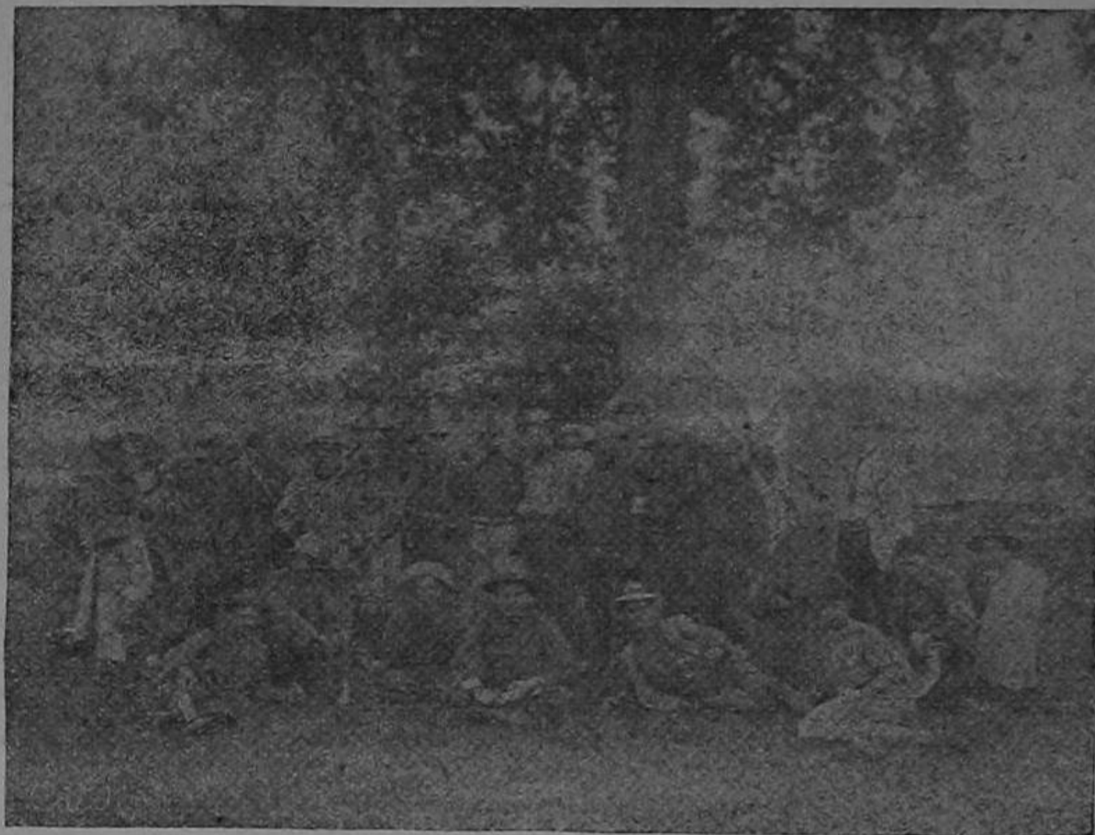
EN GOLFO DULCE

A las 18 horas y 30 minutos urgidos por la marea, se emprendió el regreso. Esa noche per-