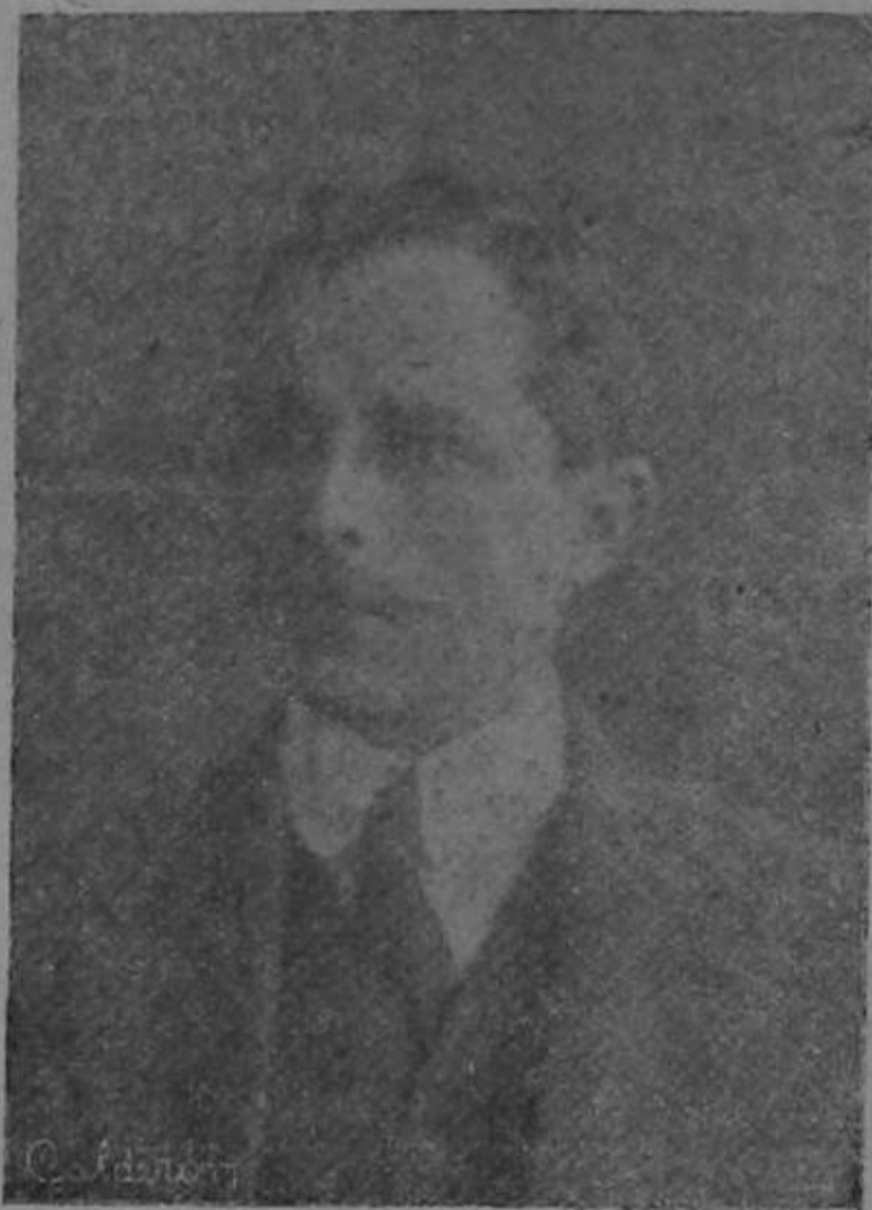
GENERAL FERNANDO CABEZAS